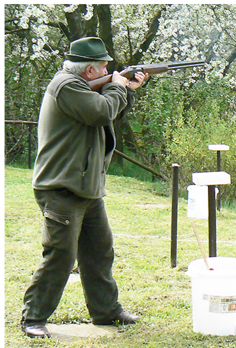
Foto: Soutěž ve sřelbě na asfaltové holuby