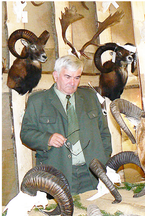
Foto: Při prohlídce loveckých trofejí na Oblastní výstavě

„ Čas je běžec s dlouhým krokem chvíli pokoj nedá si. Čas ten bere všechno skokem, za každého počasí. Čas se nikdy nezastaví, čas nám, pane, myje hlavy stříbrem na vlasy“.