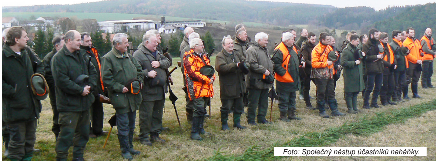
Foto: Společný nástup účastníků naháňky.