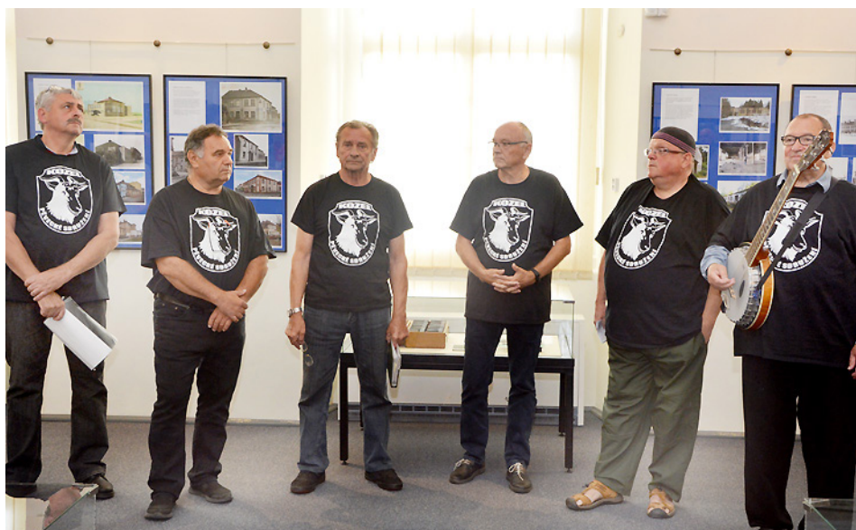
Pěvecké sdružení Kozel v Mariánské Týnici dne 10.9.2019