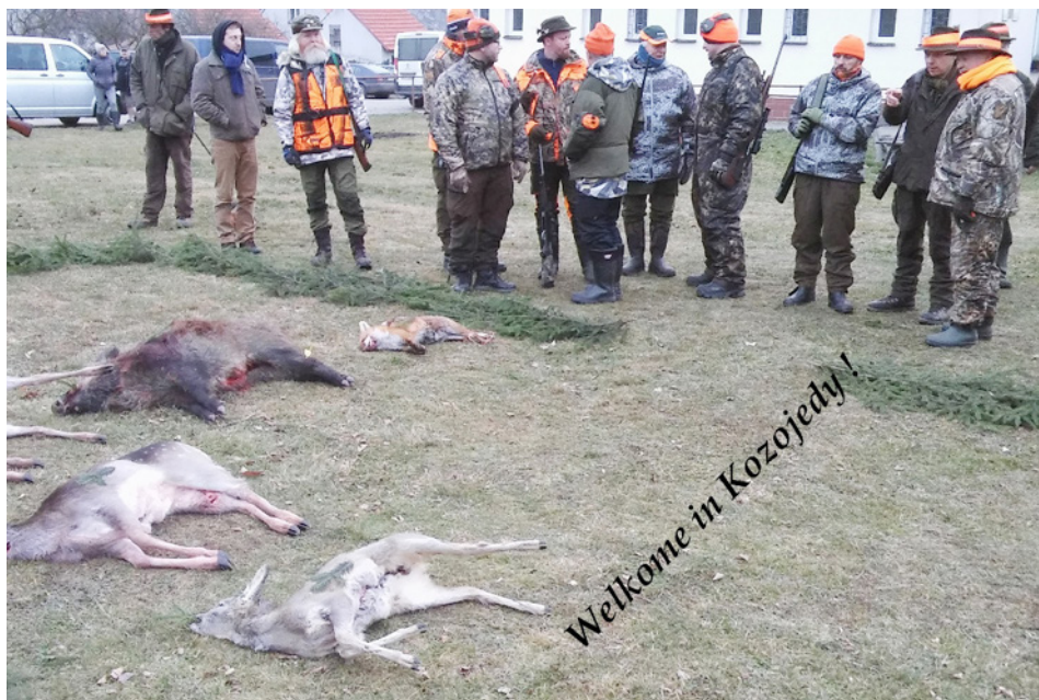
Foto k článku ze strany 4: Část lovců z Norské výpravy před výřadem – 3. 12. 2017