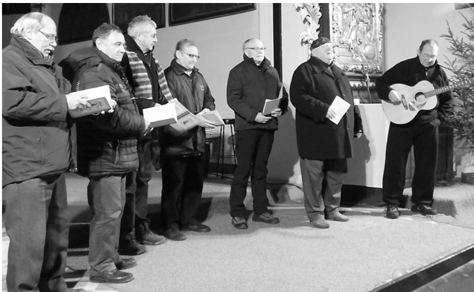
Dlouho připravované vystoupení v kostele Sv. Mikuláše v Kozojedech dne 16. prosince 2017 v rámci adventního koncertu, jehož hlavním aktérem byl Pražský hradčanský orchestr Josefa Kocúrka.