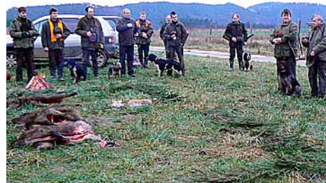
Naháňka 26. 12. 2014 – „výřad“ - účastníci naháňky za zvuků lesních rohů vzdávají poslední poctu ulovené zvěři.

Při hodnocení této činnosti se musím také zmínit o úspěšném odstřelu zvěře škodící myslivosti. V roce 2014 bylo uloveno 52