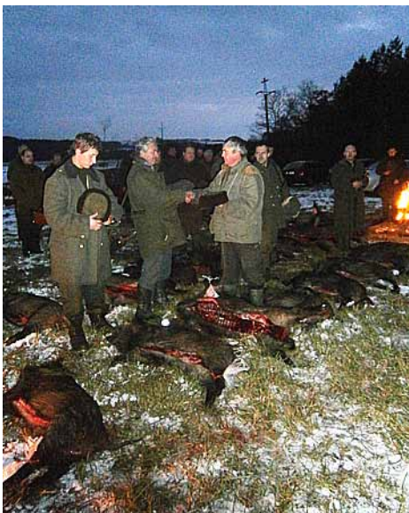
Pěkná atmosféra zimního podvečera se zapálenými vatrami, kdy vedoucí honu předává podle starodávných mysliveckých tradic úlomky úspěšným střelcům, je navíc umocněna krásnými tóny lovecké borlice, doprovázející tento závěrečný akt nahánky v Pavučině 7. 12. 2013.

Děti z kroužku myslivců vzorně reprezentovaly naše MS v soutěži o „Zlatou srnčí trofej“ v oblastním kole v Manětíně, ale také v celostátní soutěži. Velice úspěšně si vedli naši mladí trubači, kteří nejenom pravidelně doprovázejí všechny akce kozojedských myslivců, ale účinkují i na dalších akcích – soutěži mladých trubačů v rámci výstavy NATURA VIVA v Lysé nad Labem, mysliveckých dnech v Manětíně, vystoupení při odhalení sochy sv. Jana Nepomuckého v Dolanech, Kozojedském kulturním létě, Mysliveckém odpoledni, setkání trubačů v „Lomečku“ v Litohlavech, vánočním troubení u stromku v Klabavě a dalších.