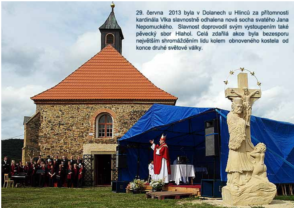
29. června 2013 byla v Dolanech u Hlinců za přítomnosti kardinála Vlka slavnostně odhalena nová socha svatého Jana Nepomuckého. Slavnost doprovodil svým vystoupením také pěvecký sbor Hlahol. Celá zdařilá akce byla bezesporu největším shromážděním lidu kolem obnoveného kostela od konce druhé světové války.