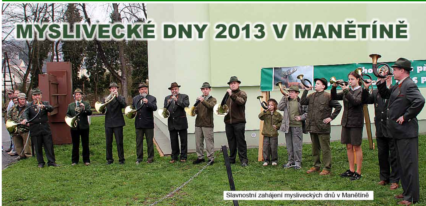
Slavnostní zahájení mysliveckých dnů v Manětíně

Ve dnech 20. – 27. dubna 2013 usku- tečnil Oblastní myslivecký spolek Plzeň ve spolupráci s městem Manětín a myslivecký- mi sdruženími Manětín, Vladměřice a Stvol- ny myslivecké dny.