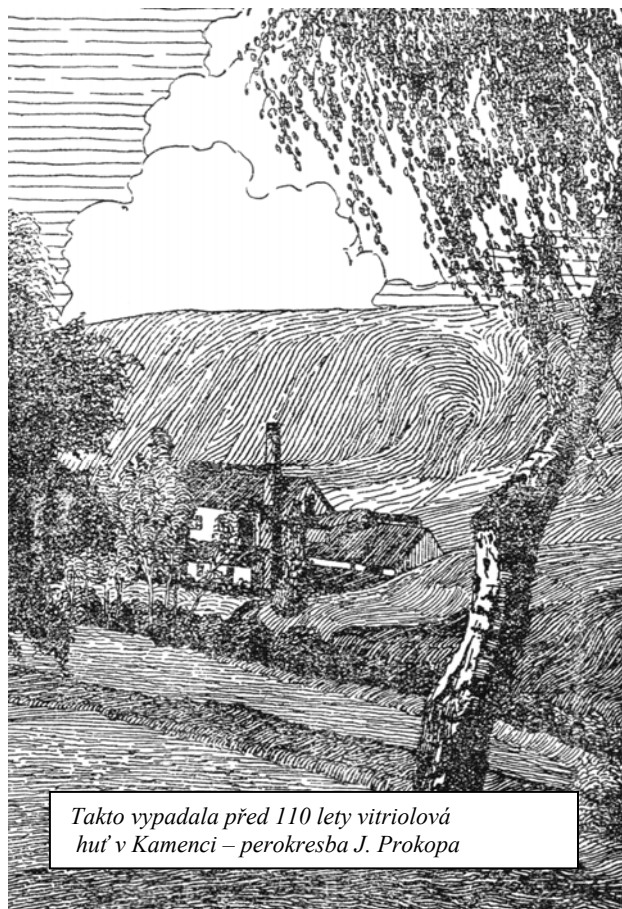
Takto vypadala před 110 lety vitriolová hut' v Kamenci – perokresba J. Prokopa

Ke konci 19. století výroba vitriolového kamene i olea