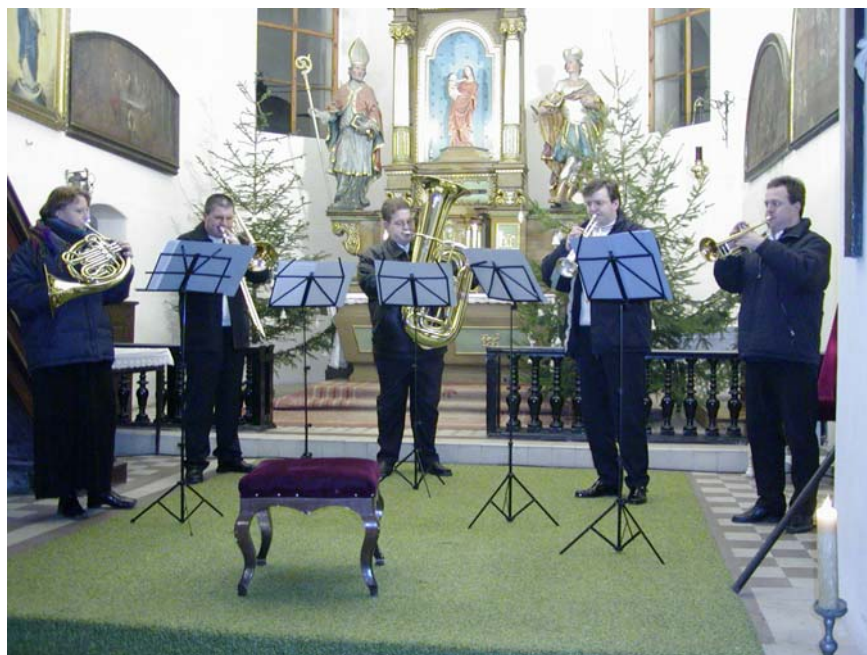
Classic Brass Kvintet – Adventní koncert v kostele sv. Mikuláše v Kozojedech